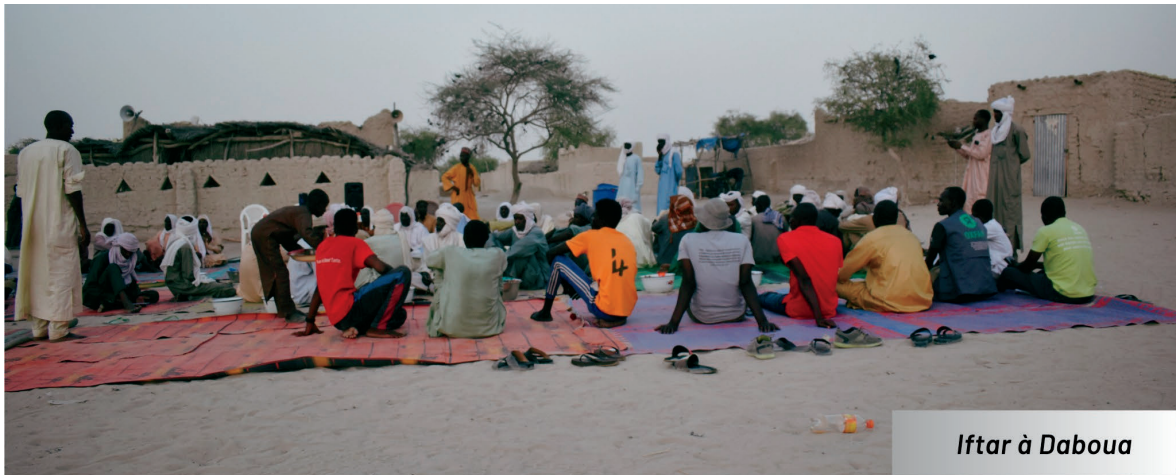
Iftar à Daboua

Après 29 jours de jeûne et à quelques heures de la fête de ramadan, les communautés des sous-préfectures de Liwa et Daboua ont organisé/réalisé une première fois les ruptures du jeûne de ramadan « Iftar » communautaires et collectives avec l'appui technique et financier d'Oxfam dans le cadre des activités d'appui aux initiatives de cohésion sociale/ consolidation de la paix grâce au projet « Renforcement de la résilience et de la cohésion sociale dans les zones frontalières du Niger et du Tchad » en abrégé "RECOSOC" financé par l'Union Européenne.