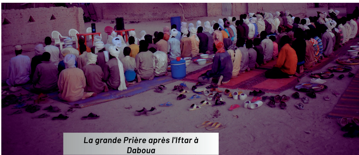
La grande Prière après l'Iftar à Daboua

Ensuite des messages de sensibilisation sur la paix ont été prononcés respectivement par les représentants des jeunes, des femmes, des personnes âgées, des corps militaires et des déplacés en langues kamenbou et Boudouma. La grande prière avant la rupture a été faite par les imams de Liwa et Daboua.